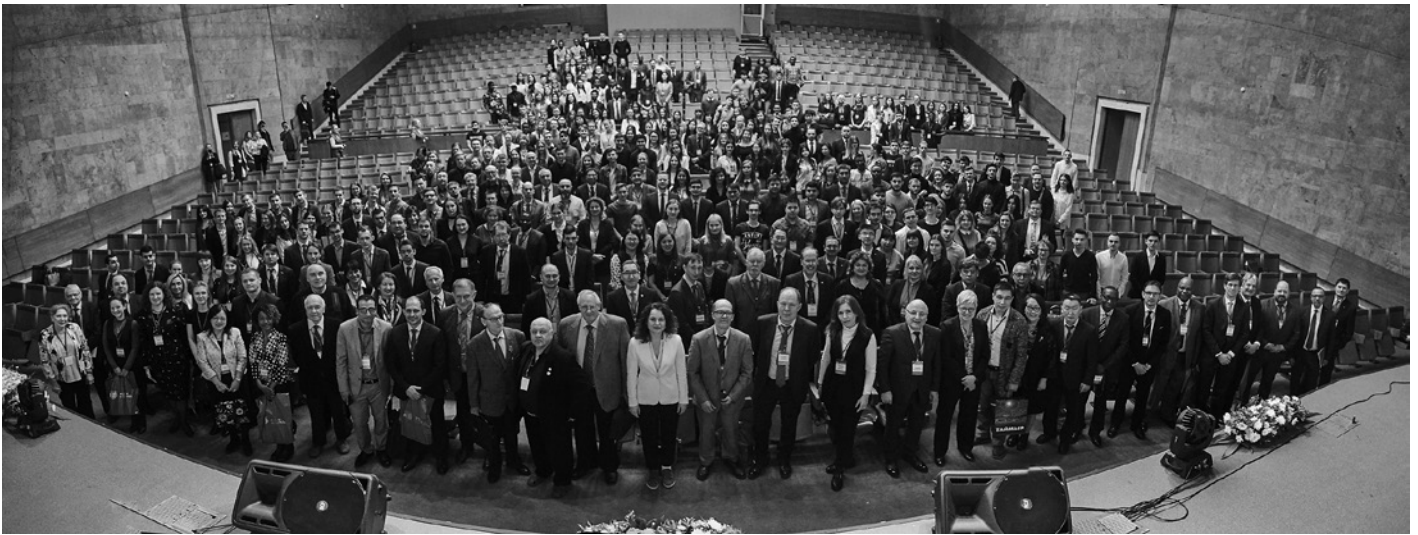
Международный конгресс «Блищенковские чтения» (РУДН, 2019 г.)

государств. То же самое относится к действиям, которые государства могут пожелать предпринять на международном уровне. Они должны представить вред климату как вред своей территории (скажем, малому островному государству), но для разрешения спора потребуется согласие другой стороны. Консультативное заключение Международного Суда могло бы быть другим вариантом, но здесь большинство государств в Генеральной Ассамблее ООН или другом агентстве ООН должны поддержать вынесение запроса. Короче говоря ... пути к судебному разбирательству узки и непросты. Но, учитывая срочность климатической проблемы, я думаю, что стоит изучить доступные маршруты.