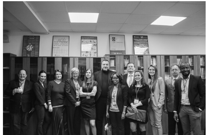
Секция по международному экологическому праву на конгрессе «Блищенковские чтения»

– Вы являетесь членом Ассоциации международного права, Комиссии экологического права Международного Союза охраны природы (МСОП), Американской Ассоциации международного права, Европейской