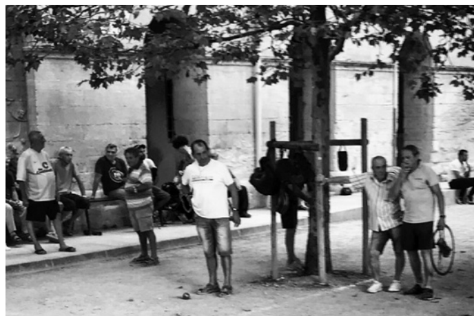
«Традиционные игры на юге Франции. »