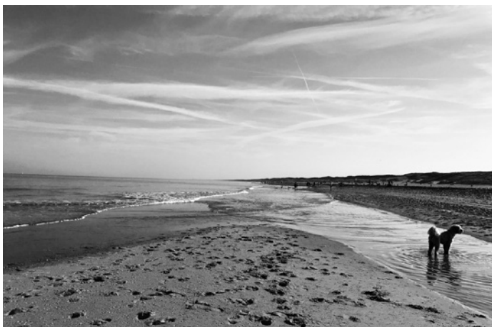
«Схевенинген (Гаага, Нидерланды).»